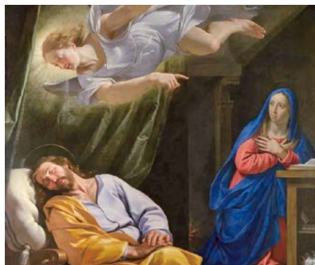
El somni de sant Josep (1643), de Philippe de Champaigne. National Gallery de Londres (Anglaterra).