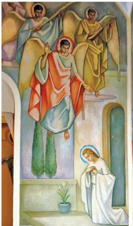
L'Anunciació. Església parroquial de Santa Maria Magdalena. Esplugues de Llobregat

Però amb una particularitat. Ja vam dir que en el Poble Jueu contemporani de Jesús hi havia molts messianismes, alguns d'ells amb la pretensió de construir el Regne Messiànic mitjançant el compromís, l'ús de la força o l'estratègia política. Maria, en canvi, segons veiem en el llenguatge que utilit-